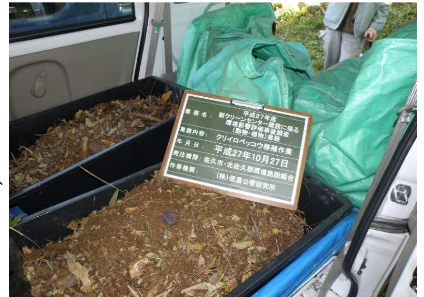
▲環境保全措置「クリロベッコウの生息基盤移植」

植物の個体移植あるいは、動物の生息基盤移植は、季節による適期があり、より効果が期待できる時季、そして方法を選定し、環境保全措置を実施しています。今後も、発芽した実生の生育管理や移植後の経過観察などをきめ細かく実施してまいります。