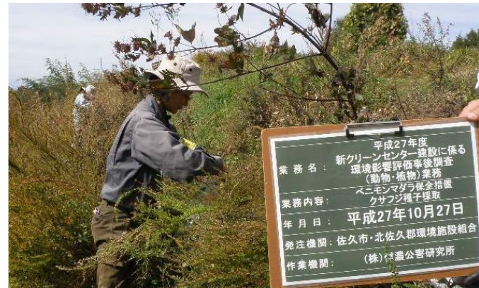
▲環境保全措置「クサフジの種子採取(播種・育苗)」

希少動物(昆虫)では、ベニモンマダラの食草である「クサフジ」の群落を生息基盤として近傍に移植する予定でしたが現地の表土一帯に法面保護用の金属ネットが敷設されていることが判明しました。代替案として現状のクサフジ群落から種子を採取、移植先にて播種し、クサフジ群落の復元を環境保全措置として実施しました。春季には、現地にてベニモンマダラの終令幼虫の移植も検討しています。