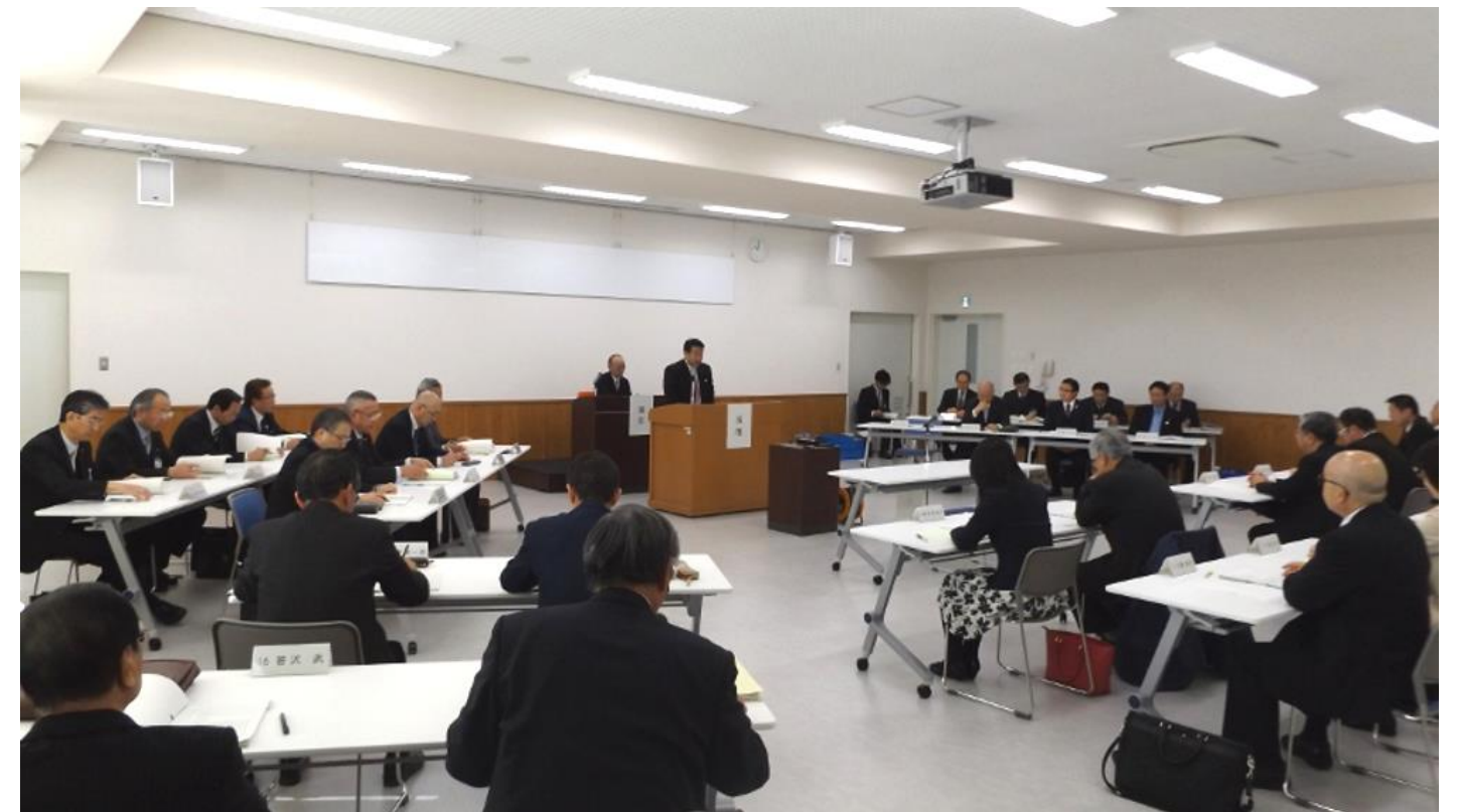
▲平成28年 佐久市・北佐久郡環境施設組合議会 第1回定例会(佐久広域連合消防本部・佐久消防署講堂)