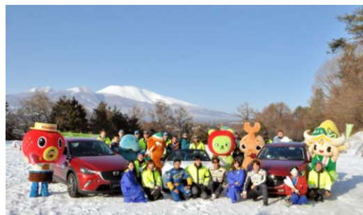
▲「みよたん」も一緒に記念撮影

また、町の観光キャラクター「みよたん」を始めとする上信越自動車道沿線のご当地マスコットキャラクターやNEXCO東日本冬道PRオリジナルキャラクター「マンモシ博士」、マナー向上キャンペーンキャラクター「マナーティ」も参加しました。