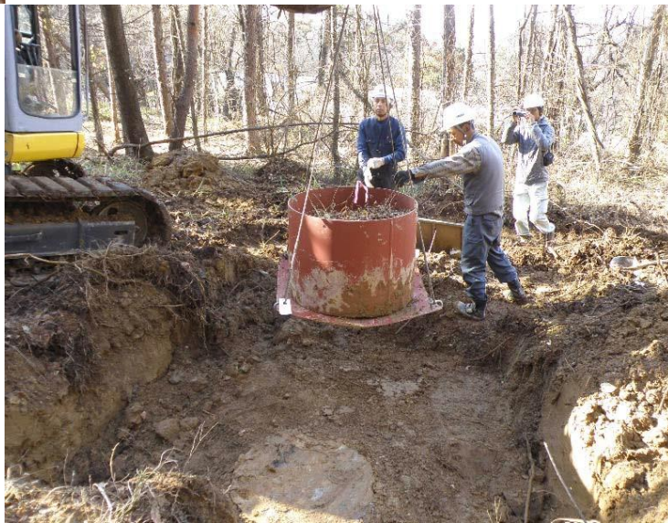
▲環境保全措置「ギンランの個体試験移植」

10月から12月に実施した環境保全措置は、動植物に係るもので、昨年、環境保全措置として希少木「オニヒョウタンボク」の採取した種子を蒔いたところ、数個体の実生が確認され、引き続き生育管理を実施しています。