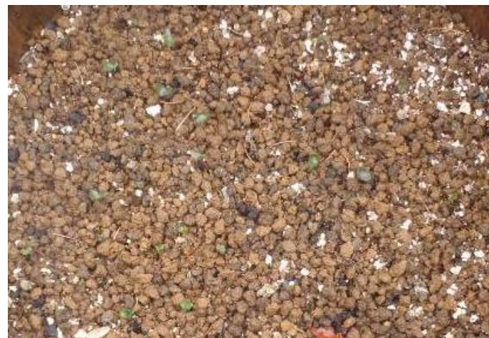
▲環境保全措置「オニヒョウタンボクの播種・育苗」

また、11月には、今年度追加で確認された希少種「ギンラン」の個体試験移植を実施しました。ギンランは、土壌中の共生菌を可能な限り広範囲にわたり確保し、個体の生育環境をできる限り変化させないように移植することが適当であるとされています。