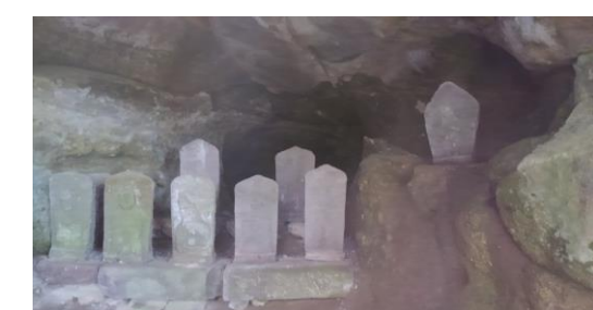
2 / 2 ▲関伽流山 観音穴 (佐久市香坂)

昨年11月、佐久三十三番観音の第七番札所となる佐久市香坂西地の関伽流山明泉寺を小六の娘と巡り、本堂の境内から山腹の観音堂までの参道を一丁目ごとにある石碑を写真撮影しながら