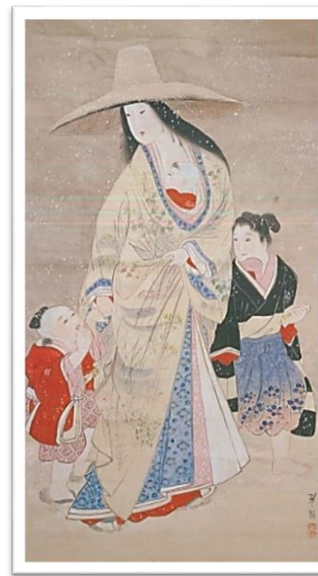
▲田口翠潭画「常盤孤を抱く」

地域文化から何かを感じるにより新たな地域づくりを生み出す契機となり、その取り組みの積み重ねが地域活性化や地域間交流、そして地域振興につながっていくものと思います。(む)