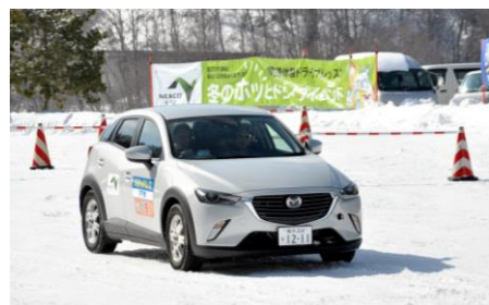
▲雪道体験ドライブレッスン

1月30日、31日、佐久スキーガーデンパラダの協力によりNEXCO東日本(ネクスコ東日本高速道路)関東支社佐久管理事務所の「雪道体験ドライブレッスン」が佐久市平根地区で物件移転作業が進む新クリーンセンター建設予定地において開催されました。