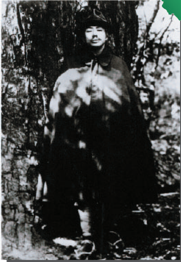
牧水最後の旅姿(43歳、没年の昭和三年の写真)

「十月十四日午前六時沼津発、東京通過、其処よりM、Kの両青年を伴い、夜八時信州北佐久郡御代田駅に汽車を降りた。同郡郡役所所在地岩村田町にある佐久新聞社主催短歌会に出席せんためである」