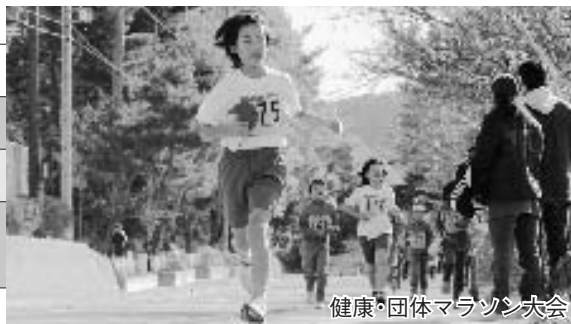
健康・団体マラソン大会

広報に関するご意見、ご感想をお寄せください。また、掲載された写真をお譲りしますので、役場総務課にお越しいただくか、電話でご連絡ください。ただし、ご希望に添えない場合もありますのでご了承ください。 ●総務課(内線71番) 町代表メールアドレス:info@town.miyota.nagano.jp