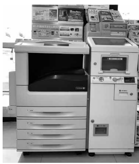
コンビニに設置されたマルチコピー機