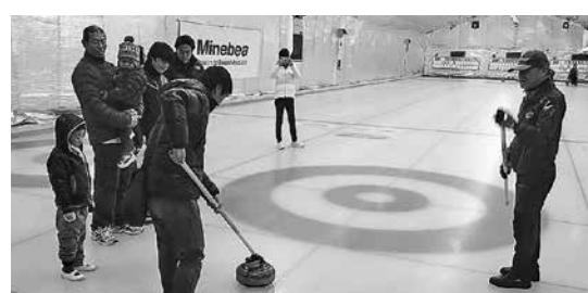
移住体験ツアーで行われたカーリング