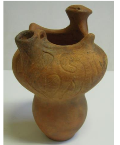
▲蛇に似た取っ手を持つ土器

11月23日、栄町公民館で新そばを味わった後、浅間縄文ミュージアムの企画展「土器のデザイン～はじまりのうつわ～」を見学していると湯川の河岸段丘上にある面替小谷ヶ沢遺跡の縄文時代竪穴式住居跡から出土された蛇に似た取っ手を持つ珍しい注ぎ口のある土器が展示され、龍になった甲賀三郎、その物語を著した柳田先生、信濃考古学会を結成した神津猛氏など、様々な縁に思いを巡らせ、しばらくの間、その土器を見入ってしまいました。