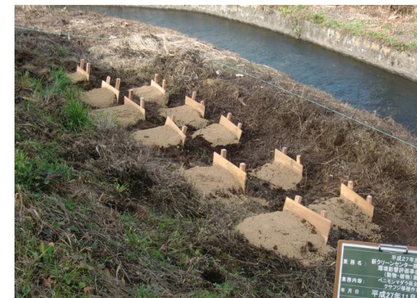
▲移植先におけるクサフジ(種子)の播種

11月24日、工事により本種の幼虫の食草であるクサフジ群落が消失してしまうことから、近隣の影響の無い場所を移植先として選定し、移植元のクサフジから採取した種を播種する環境保全措置を実施しました。来春には移植元から本種の個体を移動させ、合せて移植可能なクサフジについても移植する予定です。