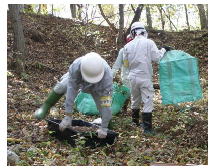
▲クリイロベッコウの移植作業の様子