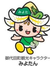
御代田町観光キャラクター みよたん

現在、新クリーンセンター建設地において物件の移転・撤去作業が行われていますので、ご理解ご協力をお願いします。また、工事に伴う建設発生土が見込まれており、受入地の募集が行われていますので、詳細は組合のホームページを確認してください。